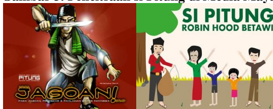
Gambar 3. Pencitraan si Pitung di Media Maya