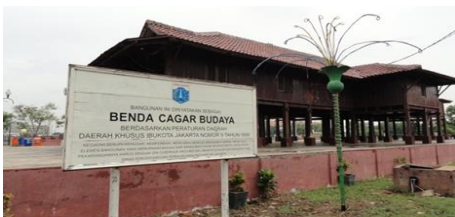
Gambar 2. Museum “Rumah Si Pitung” di Jalan Kampung Marunda Pulo, Cilincing